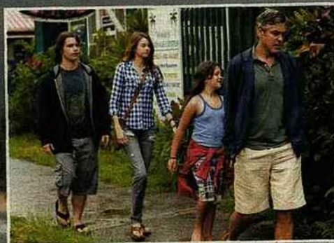
Clooney, un père en pleine crise de la quarantaine.